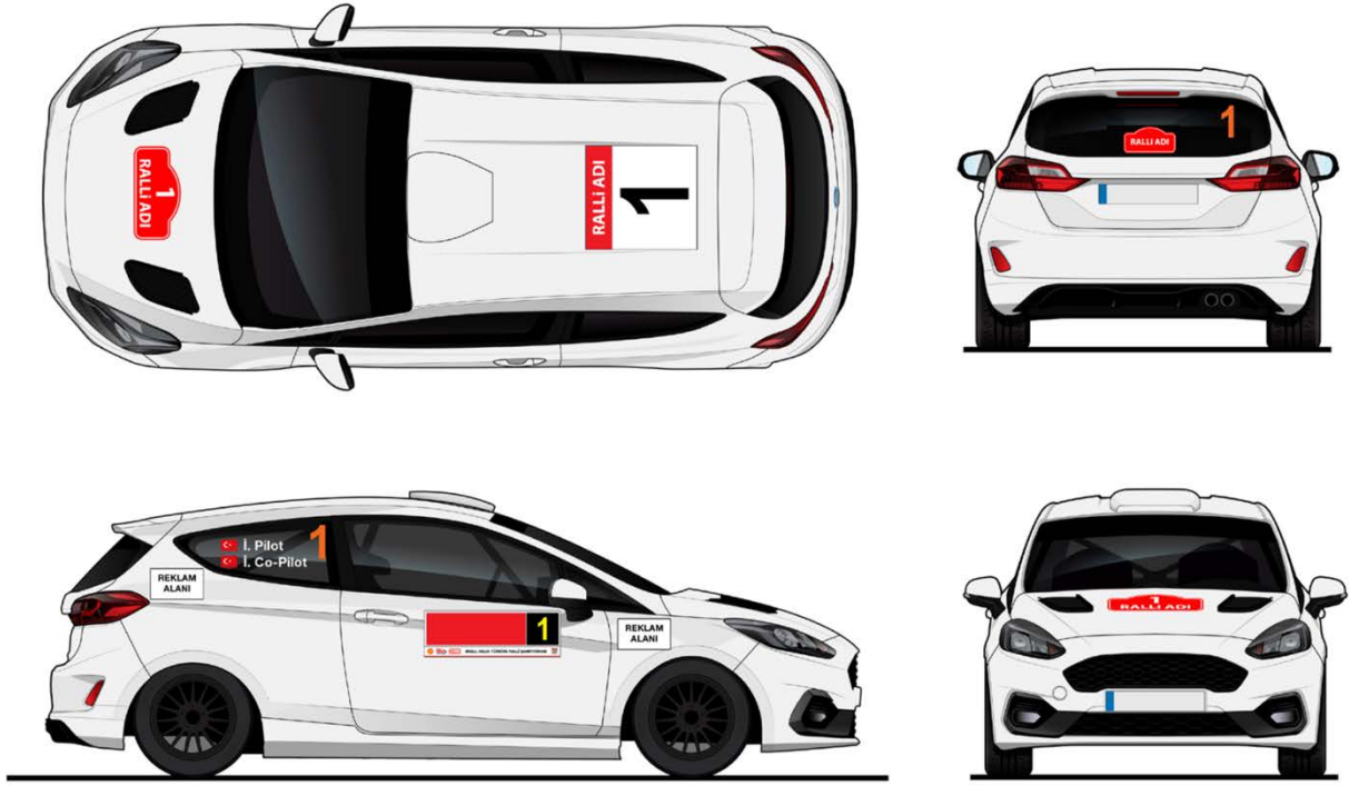
“Madde 6 Reklam ve Plakalar”